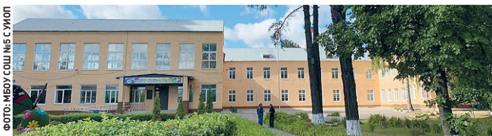
ФОТО: ИВАНОВА СОФИЯ С УЮНОМ